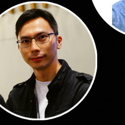
周冠威先生 香港電影編劇、導演